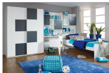
Chambre d'enfant ~ 15 m2