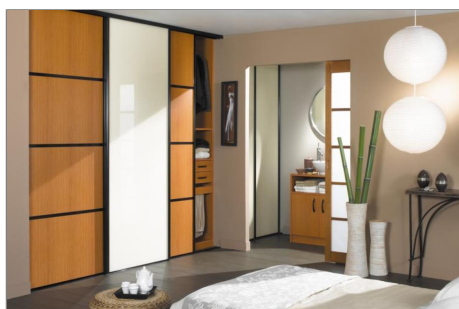
Chambre des parents 18 m2 cc